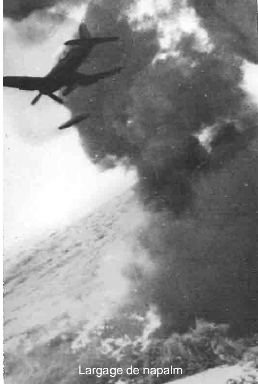
Largage de napalm