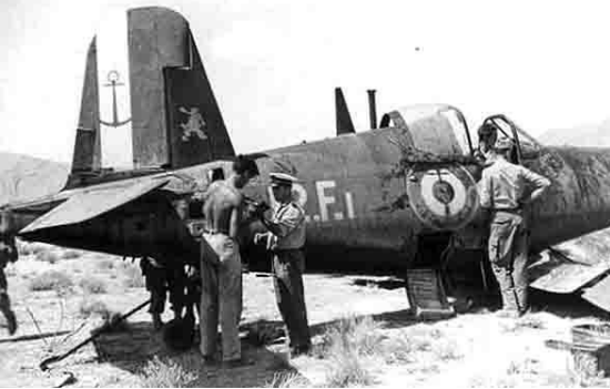
Flottille 12F – 30 août 1957 Atterrissage du Mt Kerhoas à Metlili. Seul Corsair abattu par les rebelles