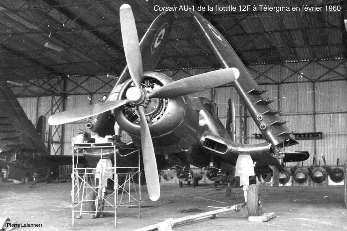
Corsair AU-1 de la flottille 12F à Téliergma en février 1960