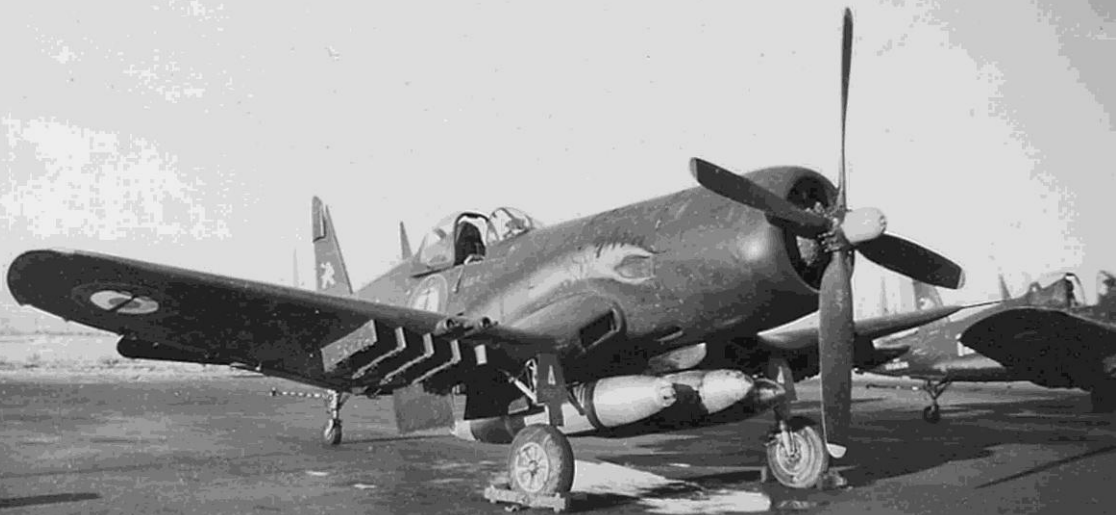
Corsair AU-1 de la flottille 12F à Téliergma en 1959