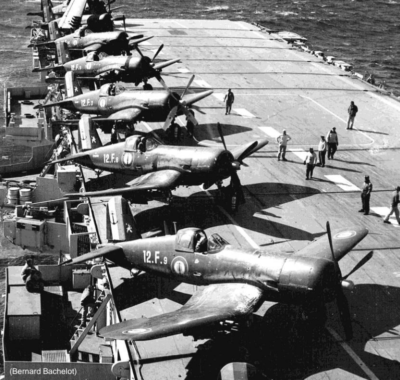
Corsair AU-1 de la flottille 12F sur l'Arromanches en juin 1960