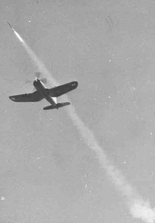
Corsair de la flottille 12F – Tir de roquette