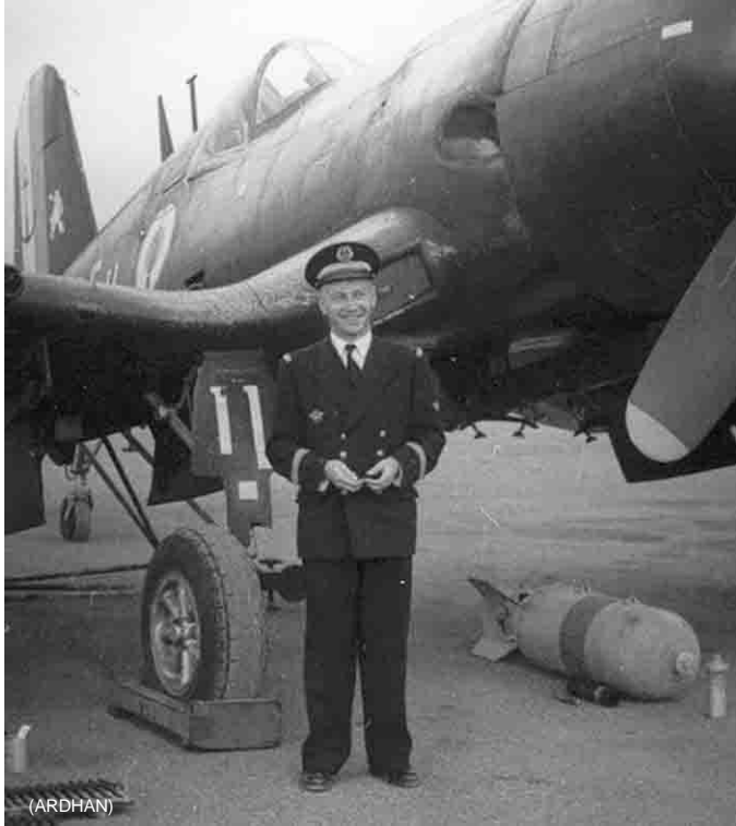
Télergma 1959 Flottille 12F LV Jacobi