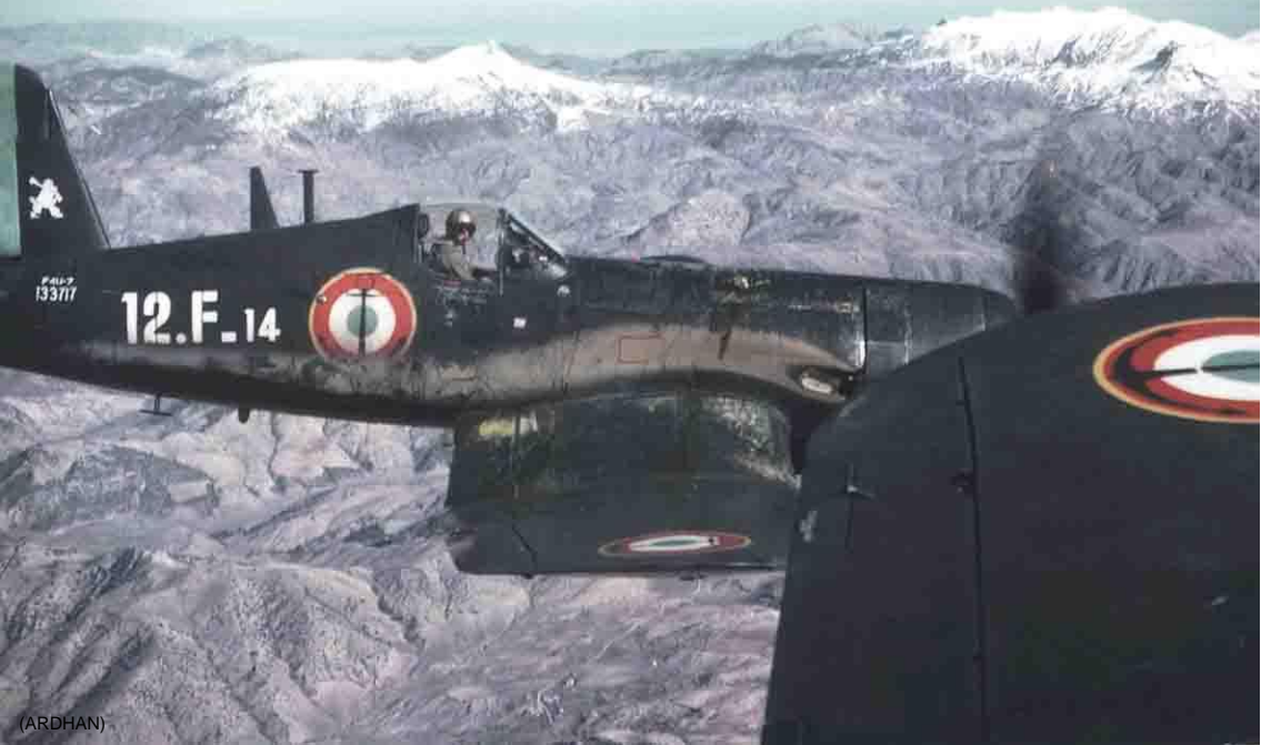
Corsair de la flottille 12F en mars 1959